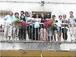
Jeunes bénévoles CONCORDIA

Merci de vous rapprocher du secrétariat de mairie pour nous informer de tout évènement à venir.