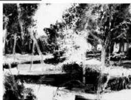
Frédéric Fau Peinture

Photographies Frédéric Fau Sculptures Sabine Canton