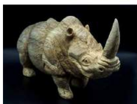
Sabine Canton Sculpture