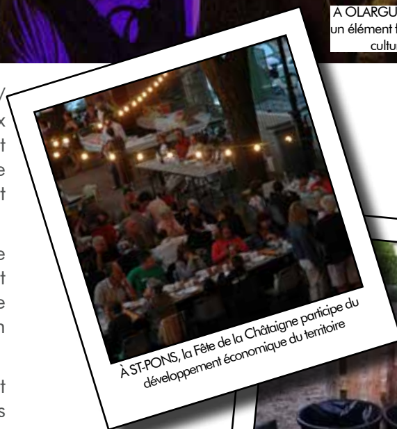
À ST-PONS, la Fête de la Châtaigne participe du développement économique du territoire

Ce « repositionnement » de l'action culturelle, fait partie intégrante du futur projet de territoire. Dans l'attente d'un diagnostic plus avancé, le territoire a d'ores et déjà confirmé son soutien aux associations pour l'année 2019.