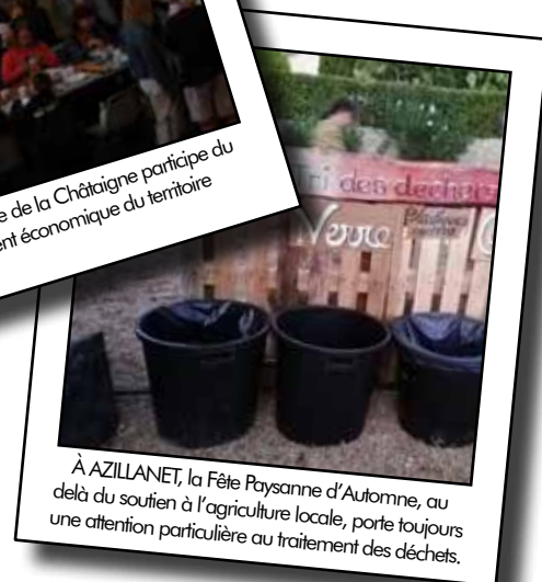
À AZILLANET, la Fête Paysanne d'Automne, au delà du soutien à l'agriculture locale, porte toujours une attention particulière au traitement des déchets.