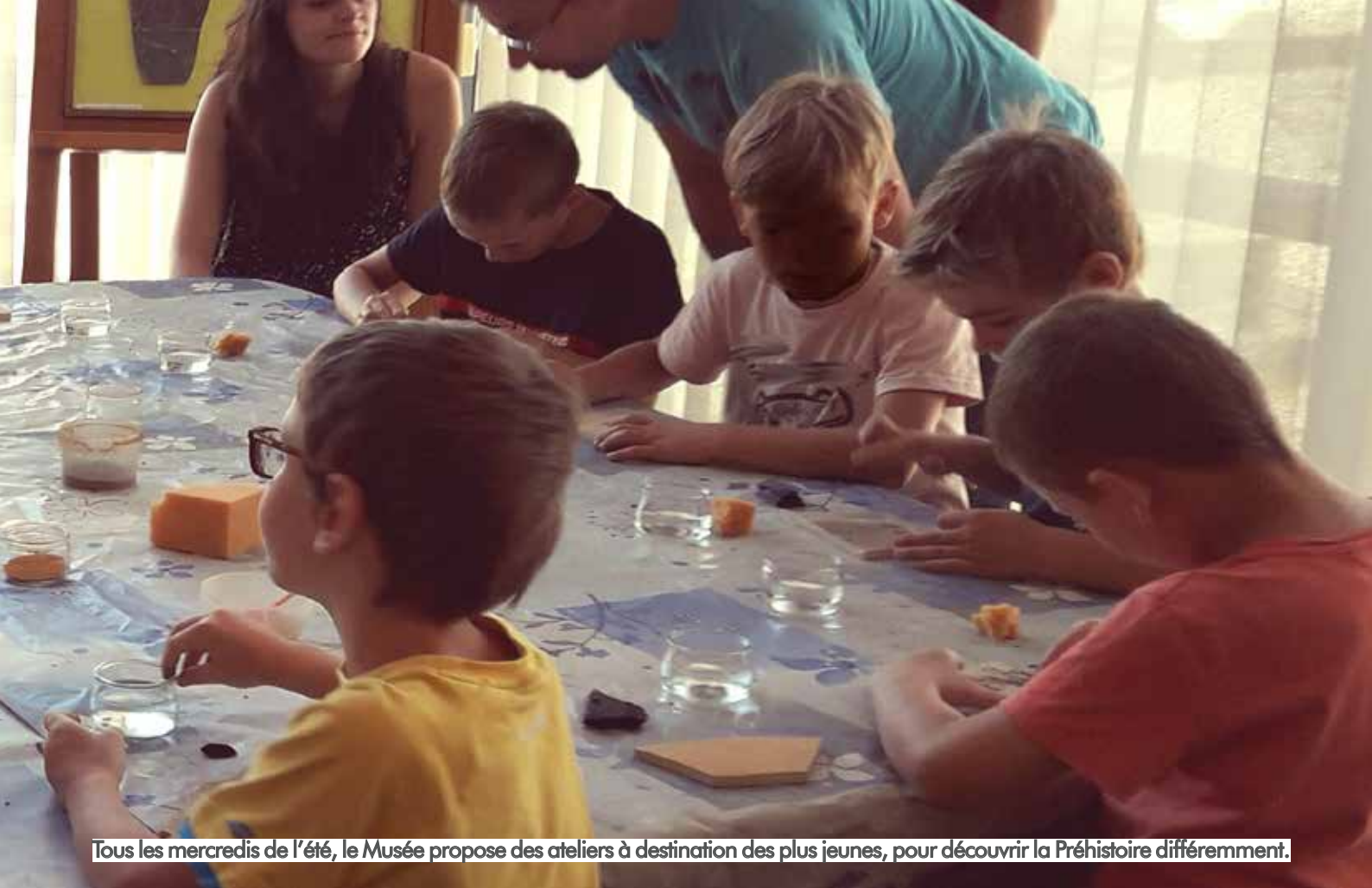
Tous les mercredis de l'été, le Musée propose des ateliers à destination des plus jeunes, pour découvrir la Préhistoire différemment.